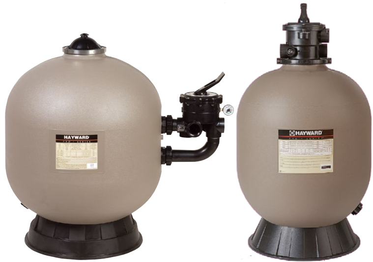
ProSeries™ HB Side